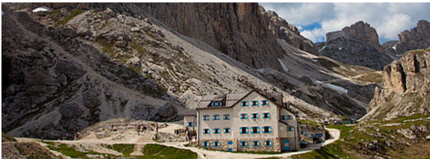
Hütten und Stützpunkte

Cortina d'Ampezzo - Sextener Dolomiten - Sella und Langkofel - Rosengarten - Palagruppe - Civetta und Moiazza