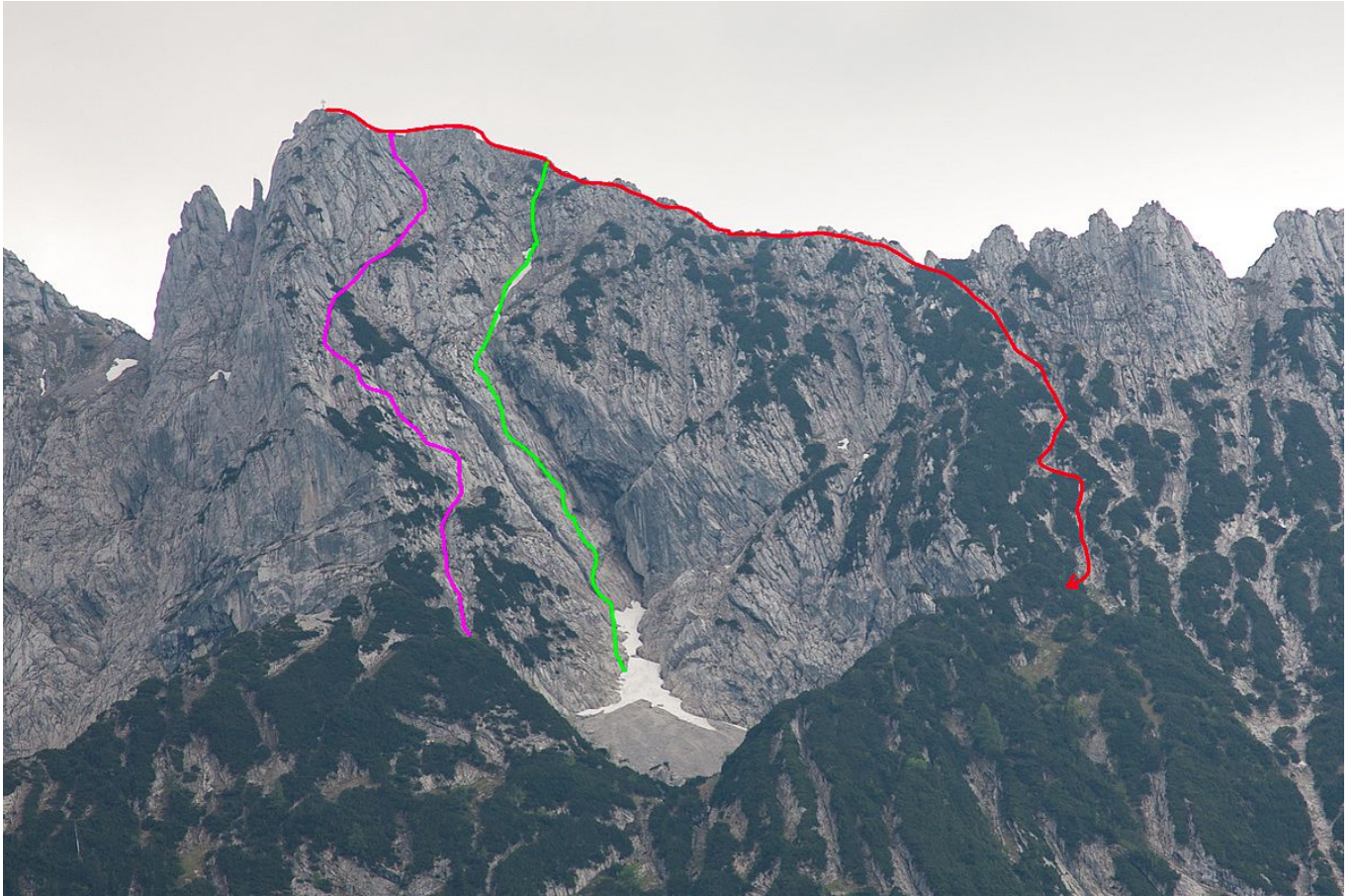
Die Nordflanke des Zettenkaiser mit eingezeichneter Kletterroute "Herbstsunn" (grün), sowie dem Direktabstieg (violett) und dem Normalweg.