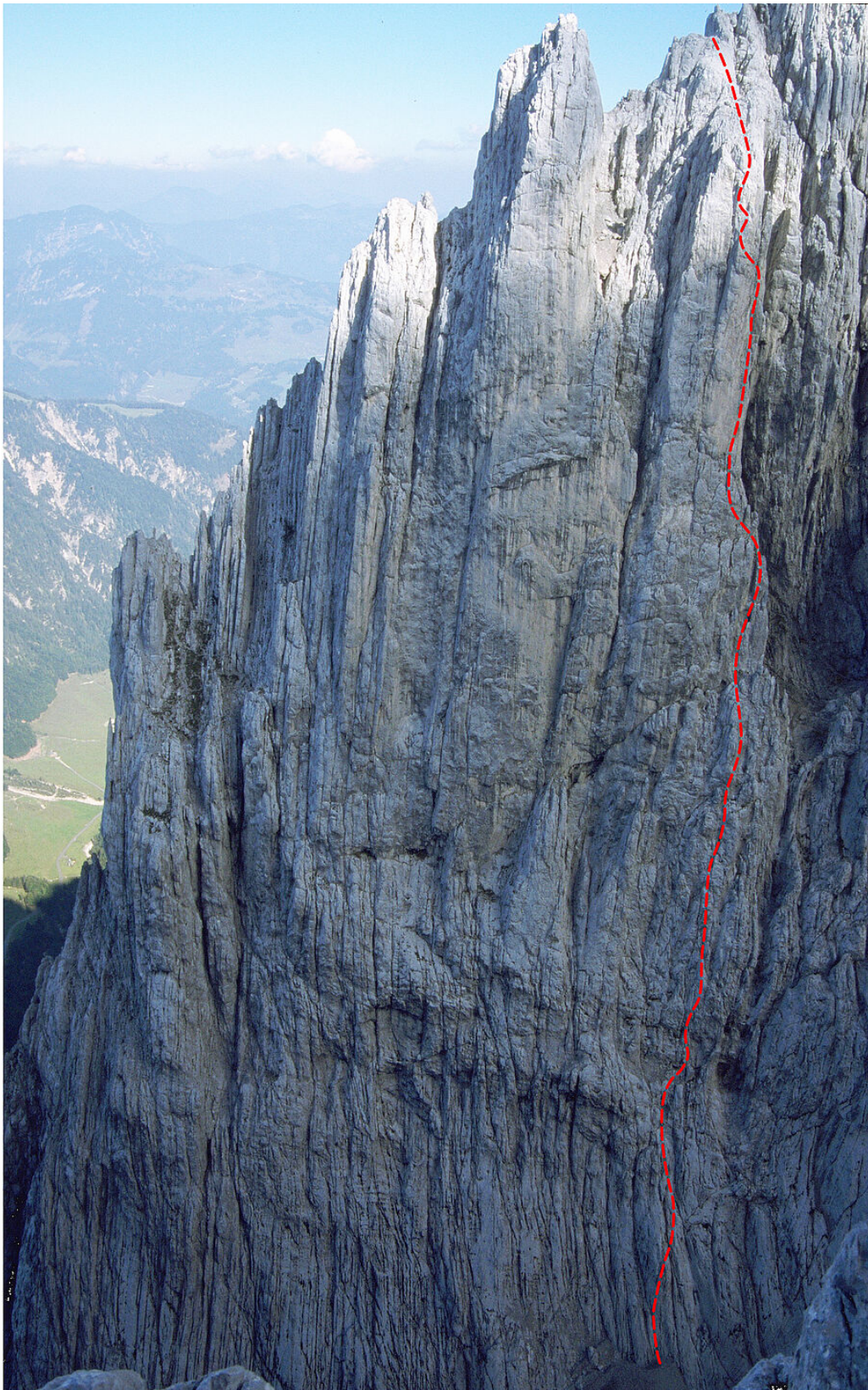
Predigtstuhl-Westwand mit dem eingezeichneten Routenverlauf vom "Koasaschmarrndrama"