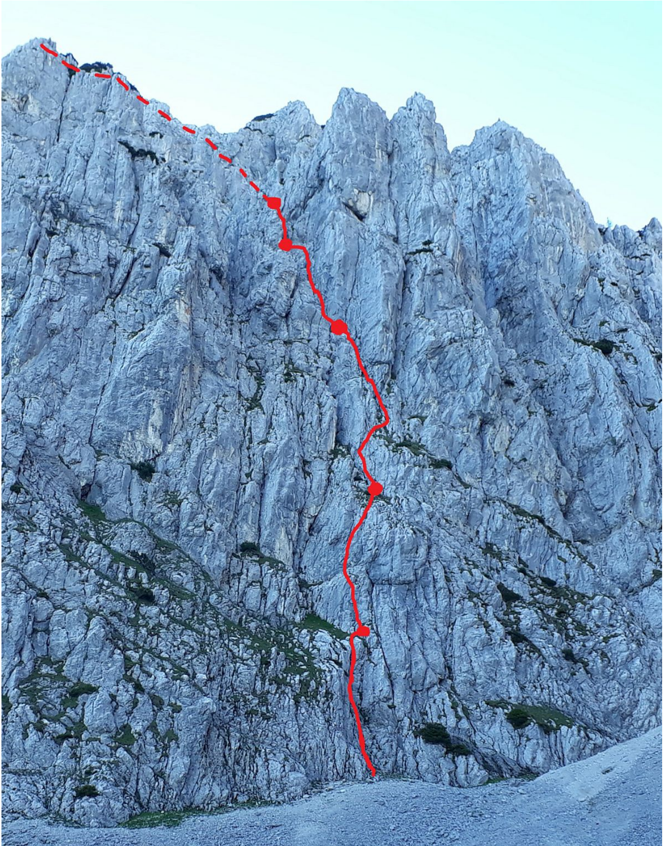
Die Wand vom Zustieg aus gesehen - der obere Teil ist nicht einsehbar.