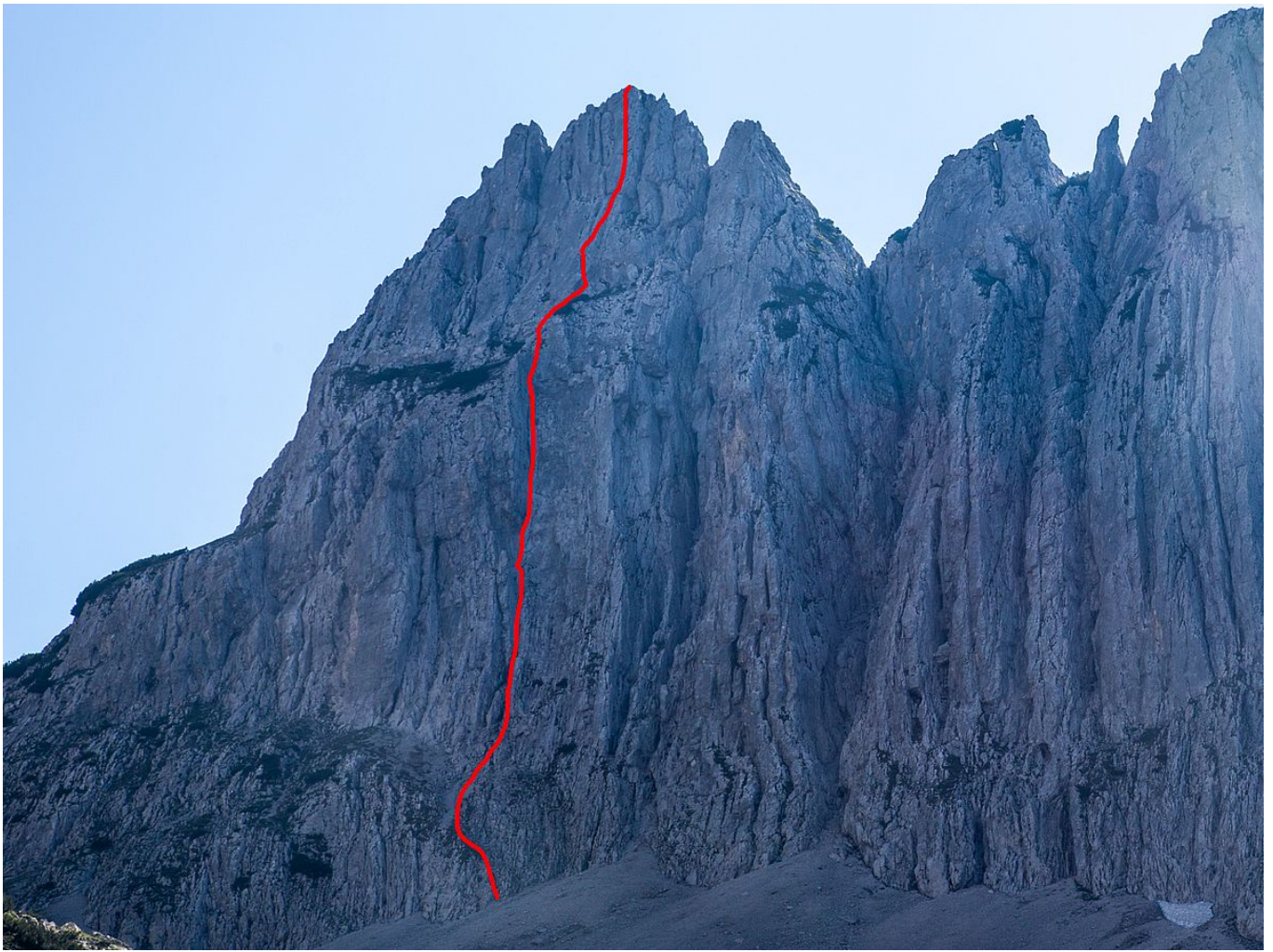
Die Ostwand des Mitterkaiser-Südgipfels