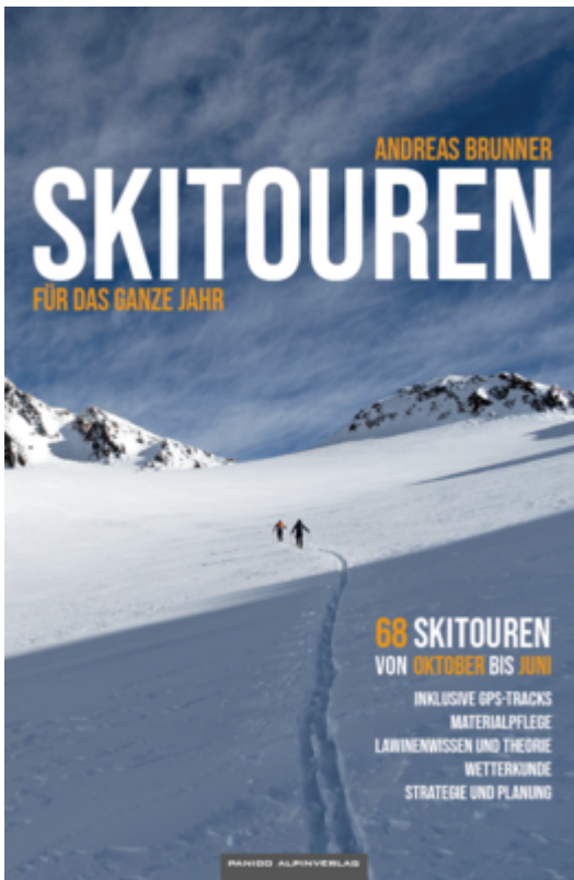
Salzburger Land - Skiführer Band 2