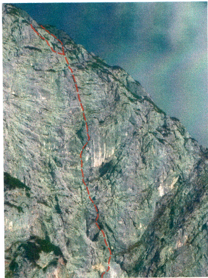
1.SL bei Regen

Links einer kurz ansetzenden Schlucht unterhalb einer plattigen Verschneidung mit weißen Streifen. In der 1SL wurden einige alte NH gefunden, Vermutlich Einstiegsvariante von R183a