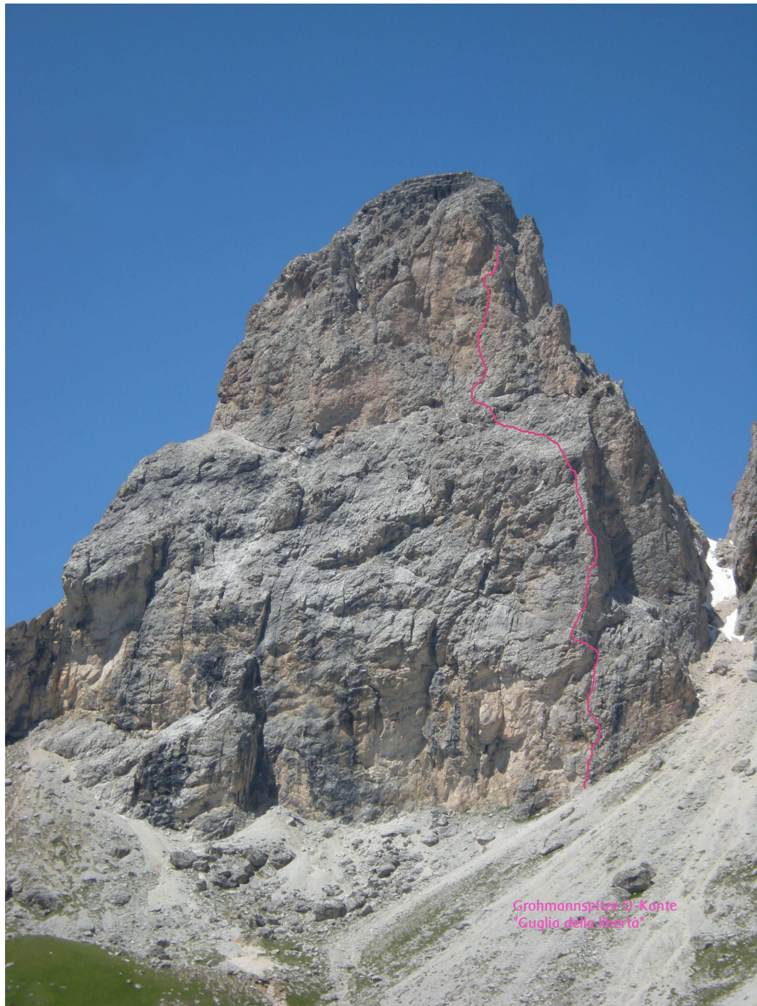
Grohmannspitze D-Kante "Guglia della libertà"