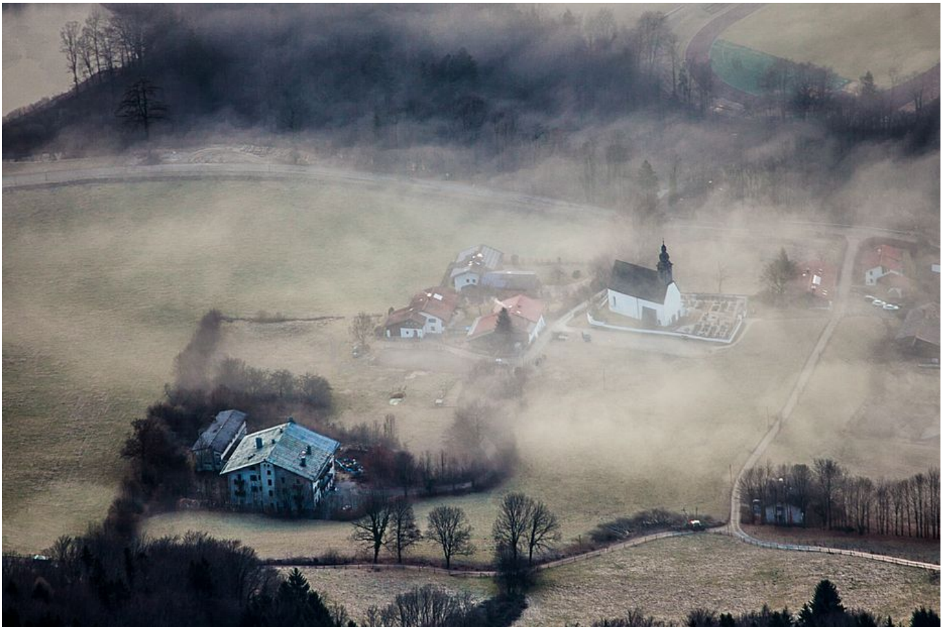
Tiefblick auf die Kirche von Nonn Zugang

Vom Parkplatz folgt man der Ausschilderung in Richtung „Hochstaufen über Bartlmahd“ erst auf einer Forststraße und dann auf einem links abzweigenden Weg. Nach etwa 1 1/2 Stunden (ca. 750 Hm) verläßt der Weg den Wald und man sieht schon den Felsturm „Alter Fritz“. An der Rechtskehre direkt am Beginn des Latschenfeldes unterhalb der Felsen quert man ca. 20 Meter nach rechts (Steinmann) und steigt dann gerade durch eine Latschengasse hinauf zum Geröllfeld rechts vom Turm. Über Geröll wenige Meter zu den Einstiegen.