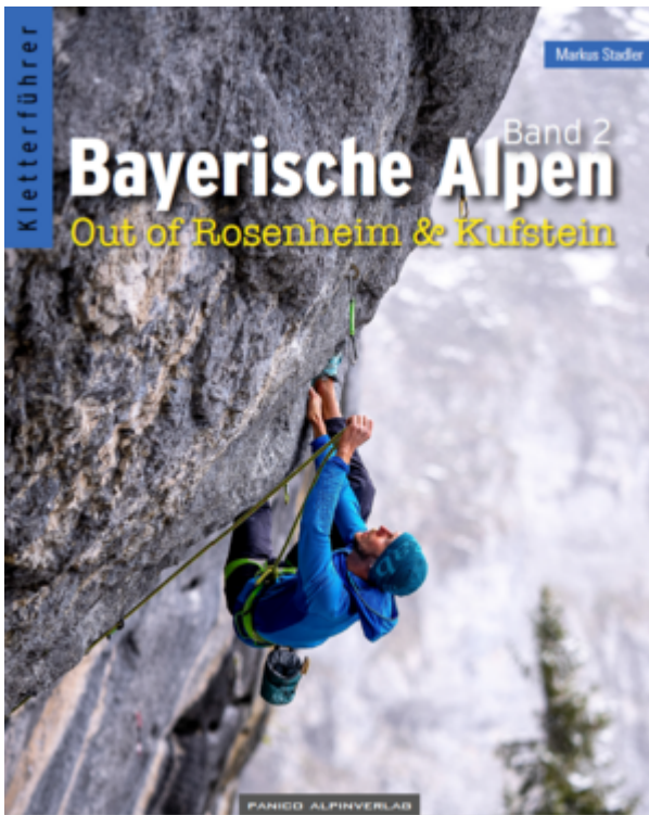
Wilder Kaiser Kletterführer