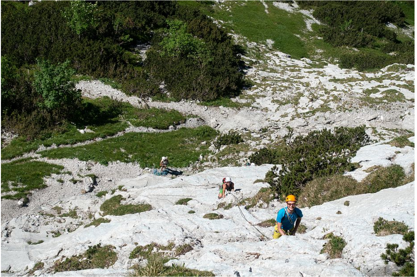
Plattiges Übungsgelände für Mehrseillängenrouten Anfahrt

ÖPNV: Die nächste Bushaltestelle befindet sich in der Griesenau, von wo aus der Zustieg etwa 1 h länger dauert als vom üblichen Ausgangspunkt beim Parkplatz an der Griesner Alm. Die Bushaltestelle wird vom VVT-Bus Nr. 4000 von St. Johann in Tirol nach Kössen/Reit im Winkl etwa alle 1-2 Stunden angefahren.