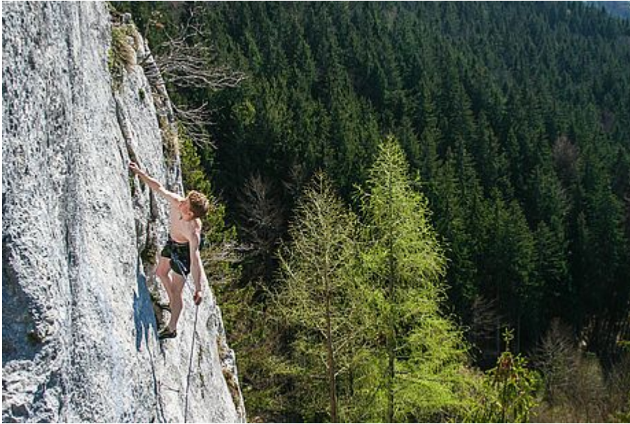
Hans bräunt sich im Altherrensommer (6+) Kletterrouten

Derzeit existieren gut 80 Routen, wobei der Schwerpunkt im 7. bis 9. Schwierigkeitsgrad liegt. Leichtere Routen gibt es auch eine Hand voll, ebenso im Bereich 9+/10- bis 10 und noch ein paar wenige Projekte. Die Felsqualität ist wechselhaft - es gibt Routen mit sehr gutem Fels, aber auch einige mit splittrigen Passagen. Generell ist gute Fingerhornhaut ratsam. Insgesamt eines der lohnendsten Sportklettergebiete im Chiemgau, das aber trotzdem weiterhin nicht allzu überlaufen ist.