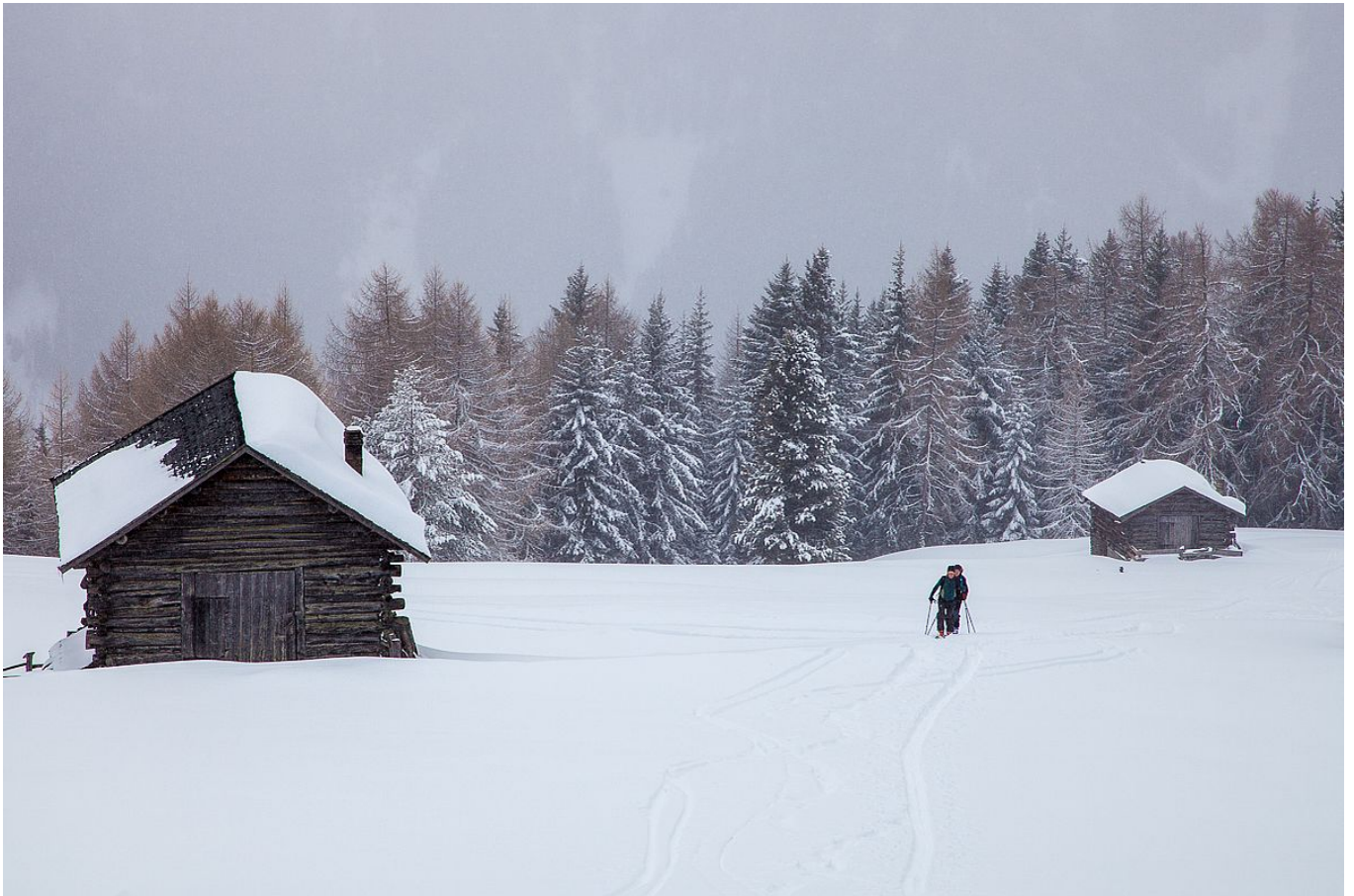
An den geneigten Wiesen der Maurer-Alm im Aufstieg zum Campill