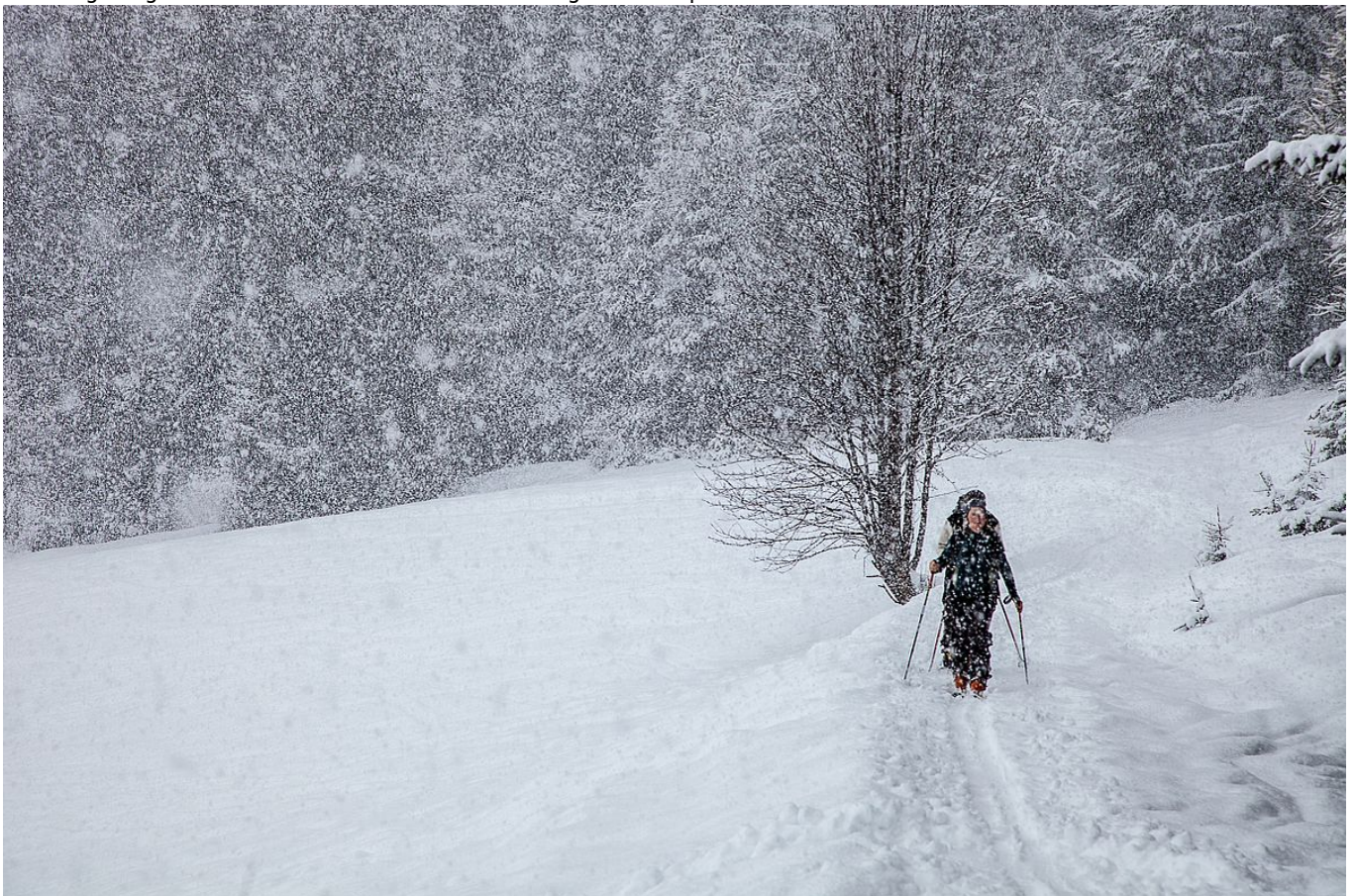
Irgendwann muss der viele Schnee ja fallen