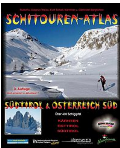
Skitourenführer: Genuß-Schitourenatlas Südtirol