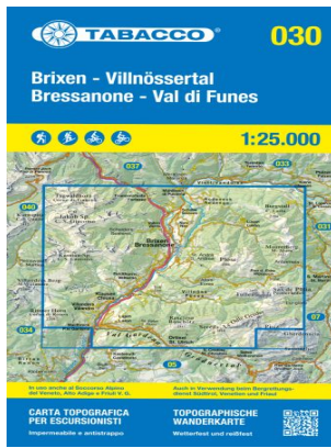
Tabacco-Karten - 030 Bressanone Brixen - Val di Funes Villnöss - Maßstab: 1:25.000