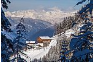
Großplonerhof in Lüsen