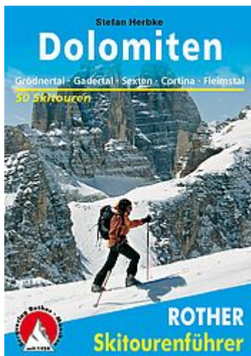
Dolomiten - Rother Skitourenführer