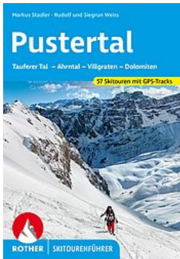
Pustertal - Rother Skitourenführer