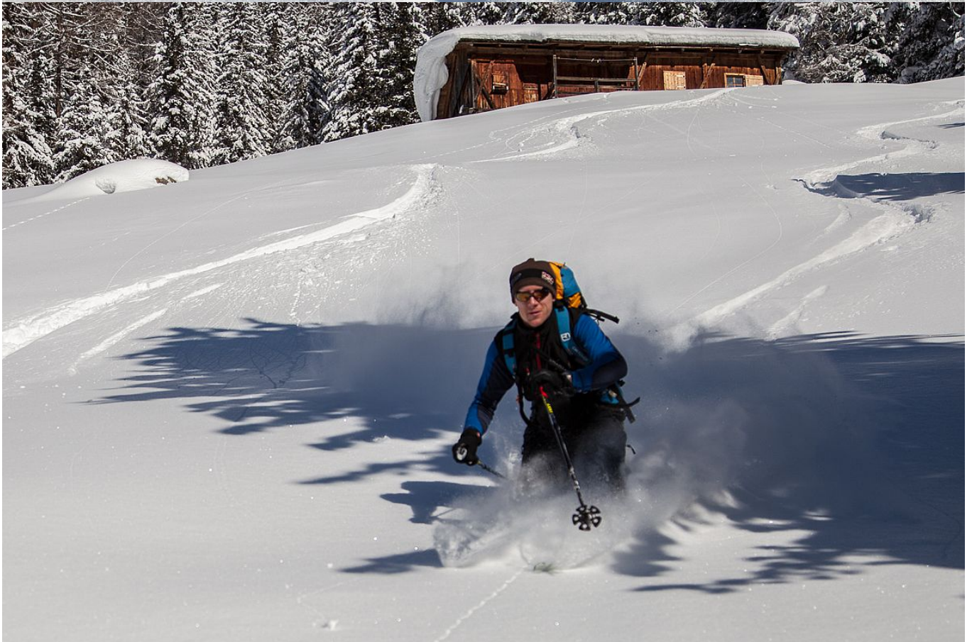
Landschaftlich schöne, einfache Skitour im Raum Brixen

Das Lüsener Tal versteckt sich oberhalb von Brixen in Südtirol hinter der Plose - dem Brixener Hausberg und Skigebiet - und ist unter Tourenggehern nur wenig bekannt. Dabei bietet es aber einige landschaftlich sehr schöne, vor allem leichtere Anstiege die oft auch bei weniger sicheren Verhältnissen noch durchführbar sind. Wer dem Trubel der bekannten Mødeziele