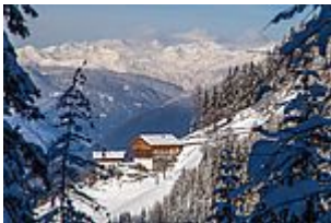
Großplonerhof in Lüssen