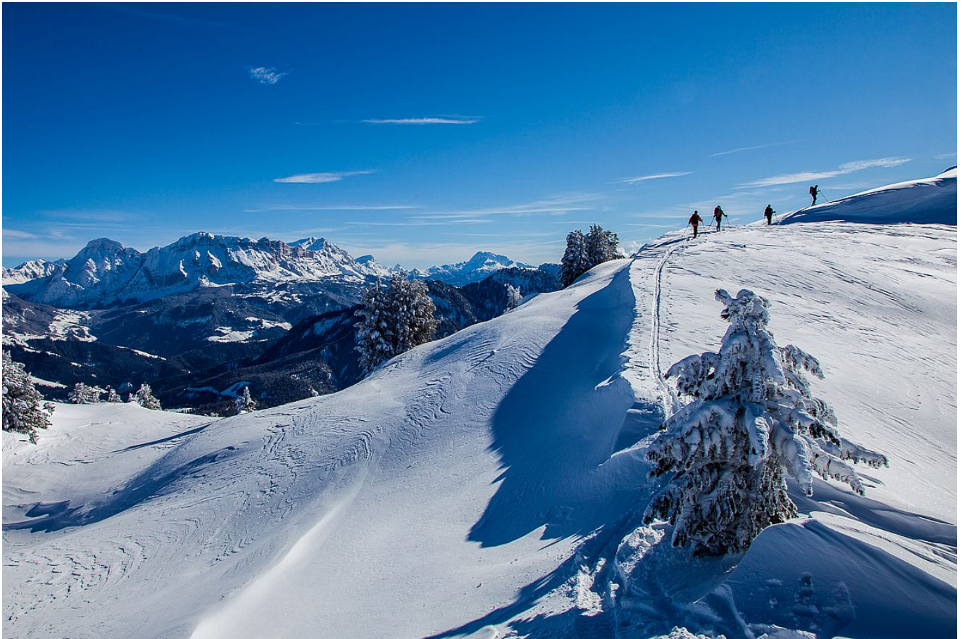
Am Gipfelkamm des Maurerbergs