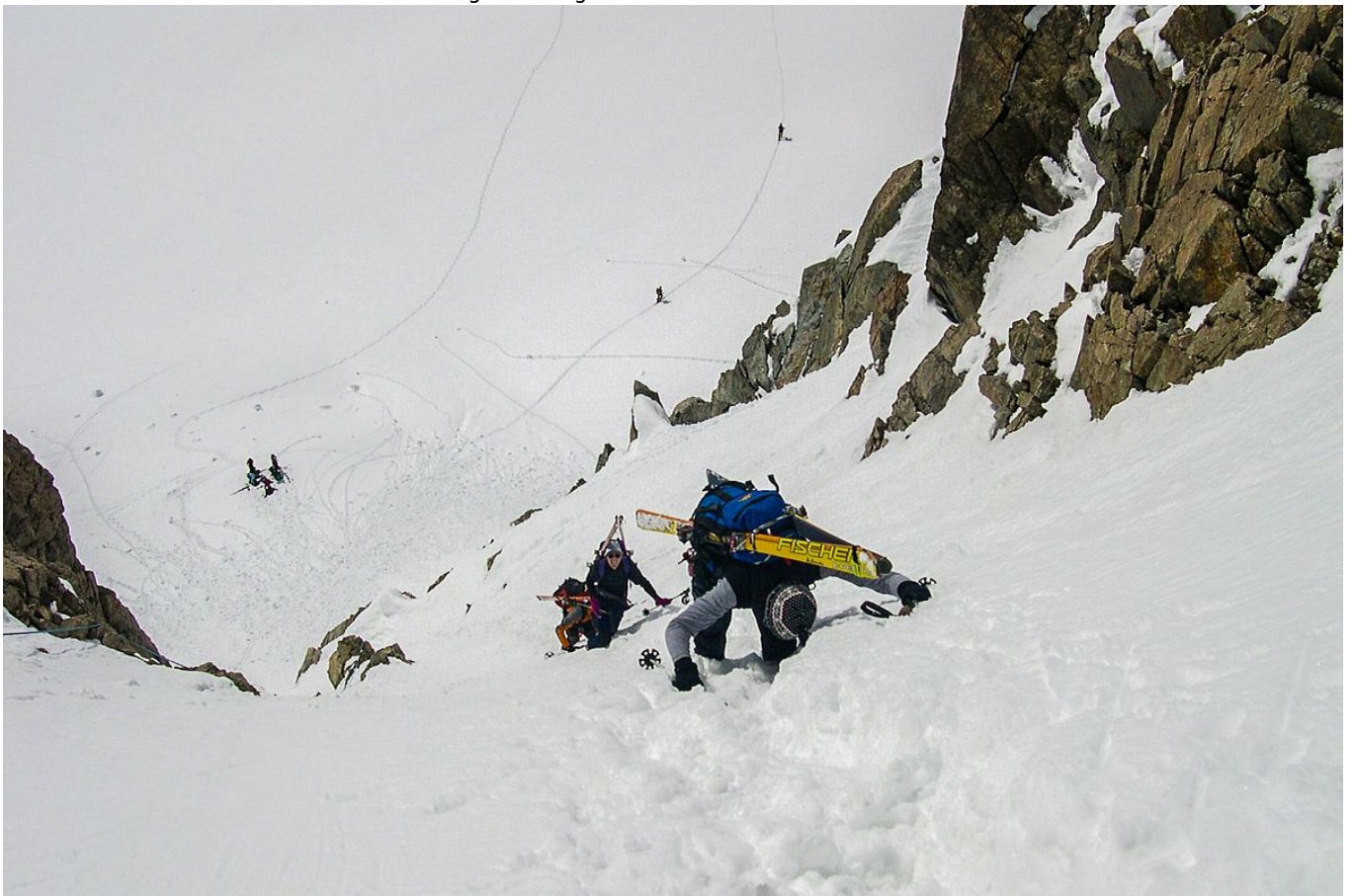
Nocheinmal warten 100 Höhenmeter Gegenanstieg hinauf in die Scharte.