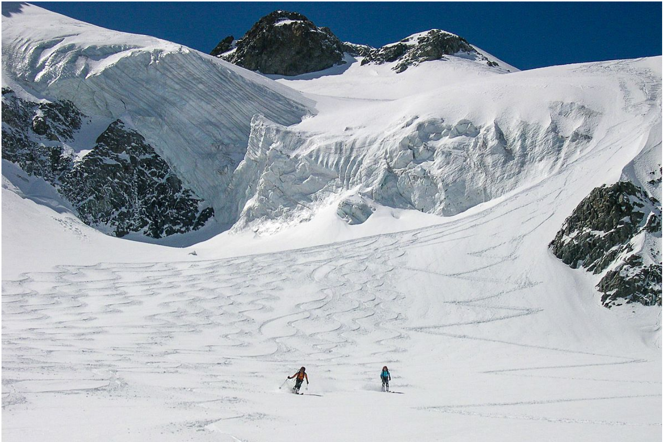
Traumabfahrt mit Traumkulisse vom Montagne des Agneaux