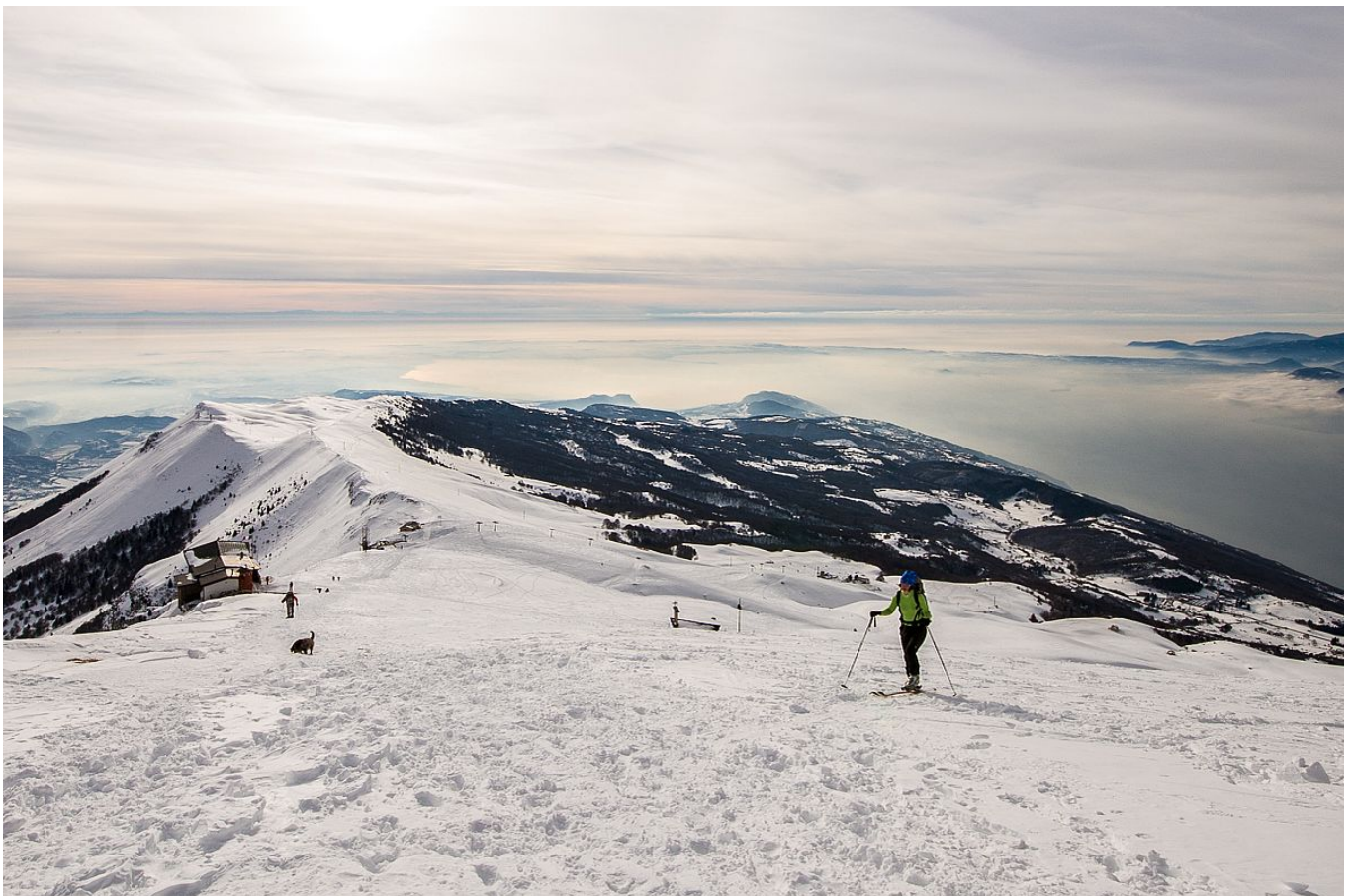
Kurz vor dem Gipfel - im Hintergrund der Lago di Garda und die Poebene Mediterrane Skitour 2000 m über dem Gardasee

Der südliche Teil des Gardasees wird durch eine sehr mediterranes Klima und dazu passende Vegetation charakterisiert. So