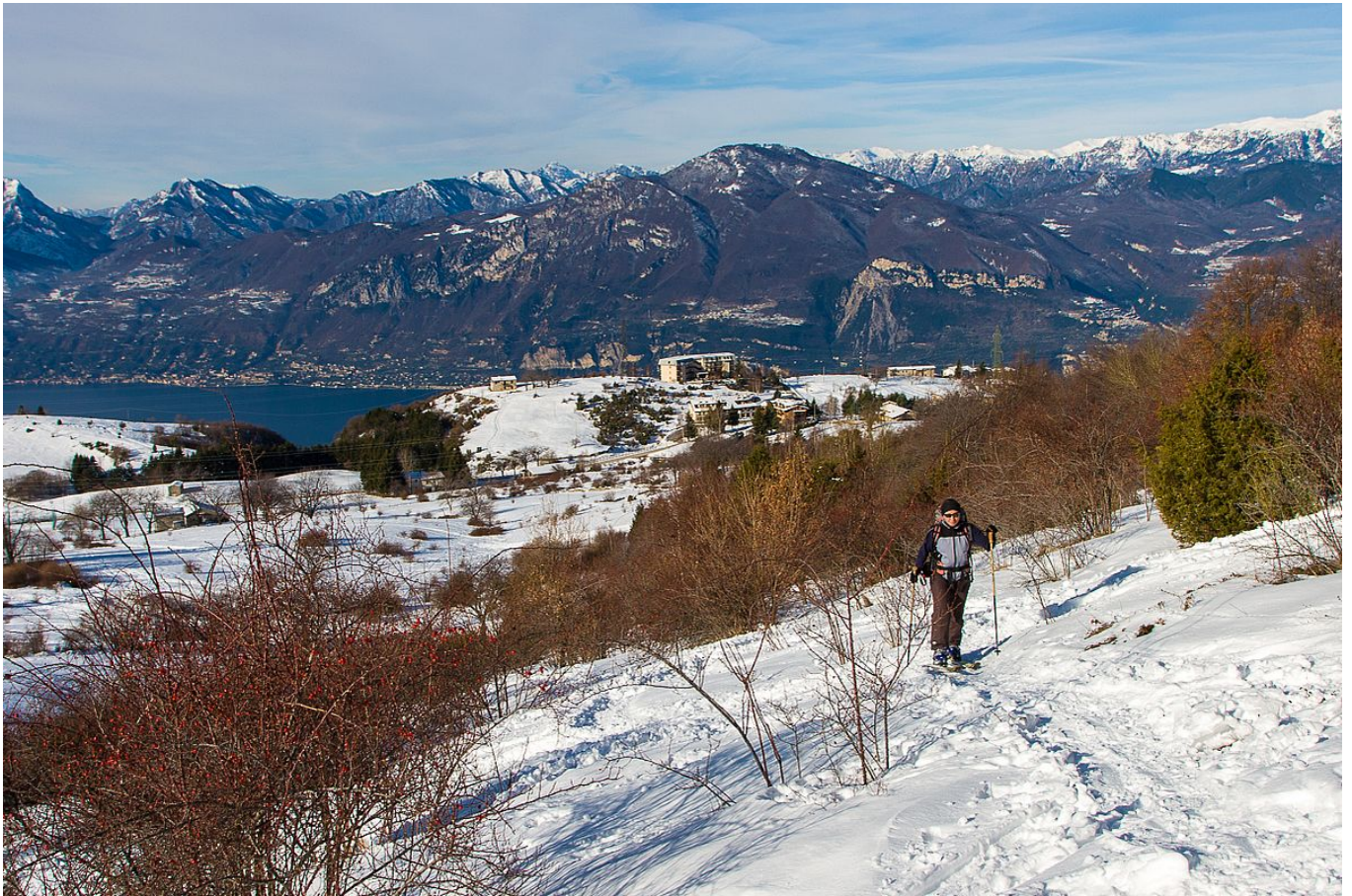
Mediterranes Gestrüpp säumt die Spur