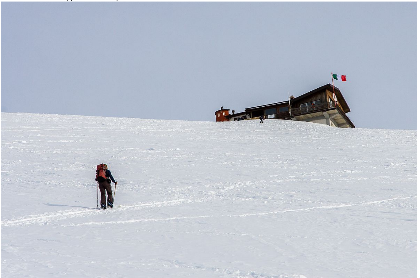
Aufstieg zum Rifugio Chiarego