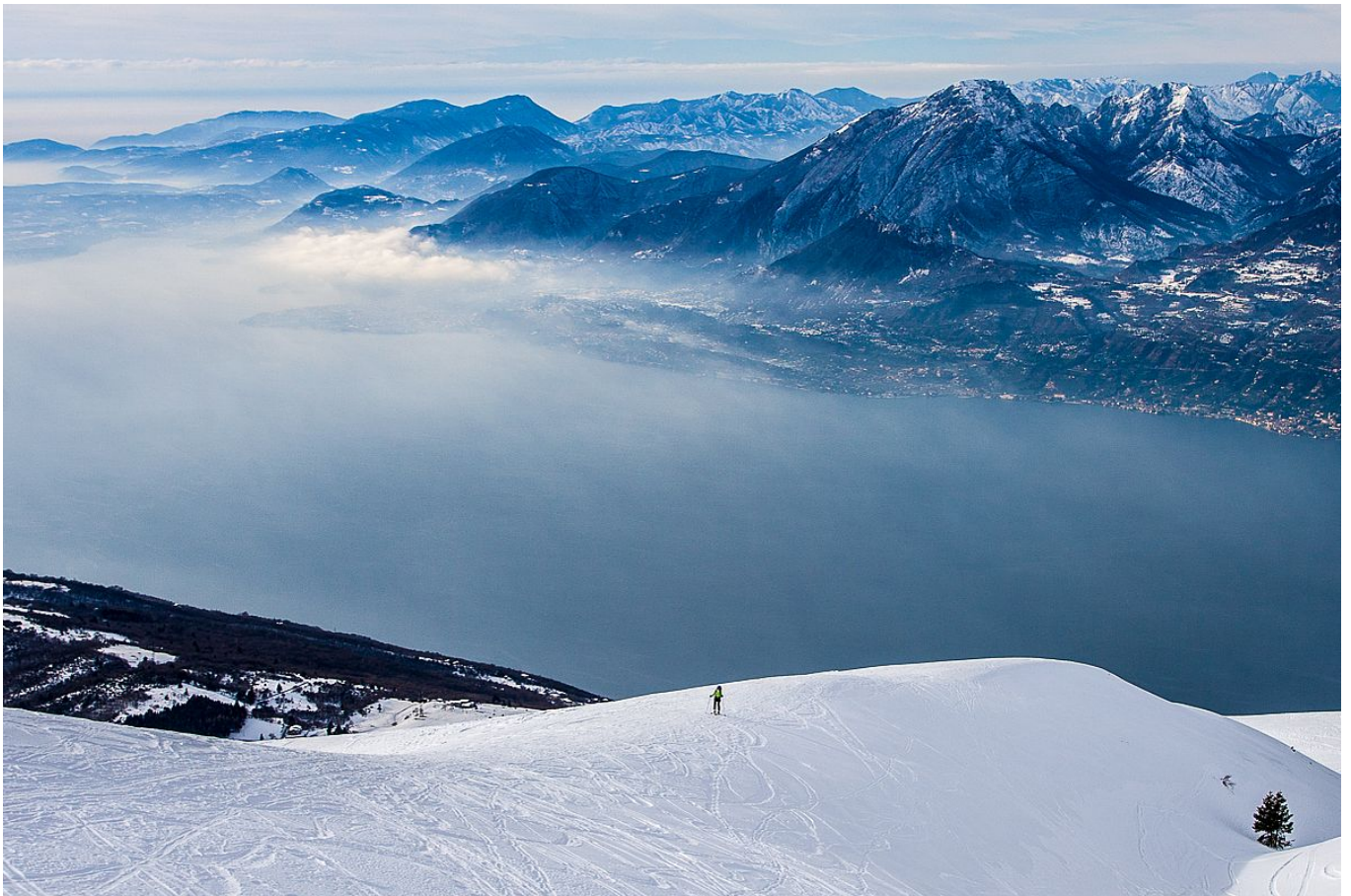
Skitouren über dem Gardasee