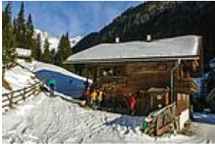
Gallfallalm im Gsieser Tal