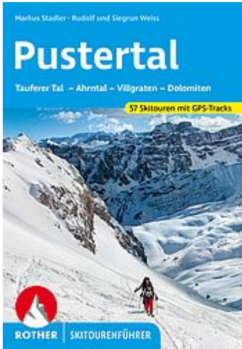
Pustertal - Rother Skitourenführer