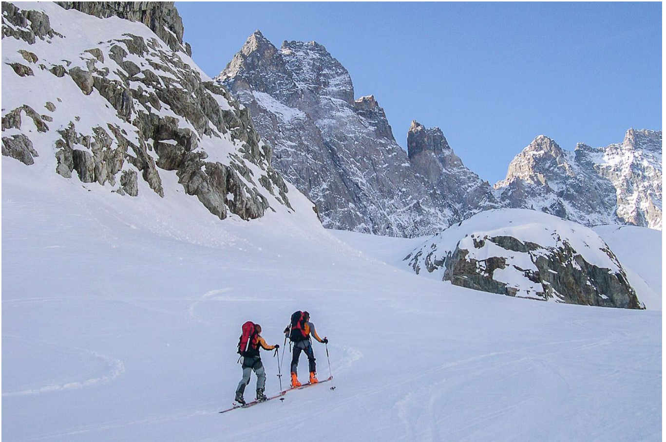
Aufstieg über den Glacier Noir Durchs wildeste Tourengebiet der Alpen

Das wildeste Skitourengebiet der Alpen liegt östlich von Briançon, weit im Südwesten des Alpenbogens. Dort finden sich zwischen steilen Felswänden und zerklüfteten Gletschern geniale Skitouren-Möglichkeiten. In eindrucksvoller Landschaft konnten wir im April 2006 hier eine Durchquerung der allerfeinsten Sorte unternehmen, die ich nachfolgend näher beschreiben möchte.