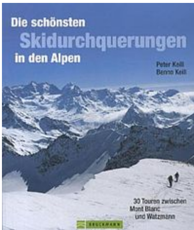
Skidurchquerungen der Alpen