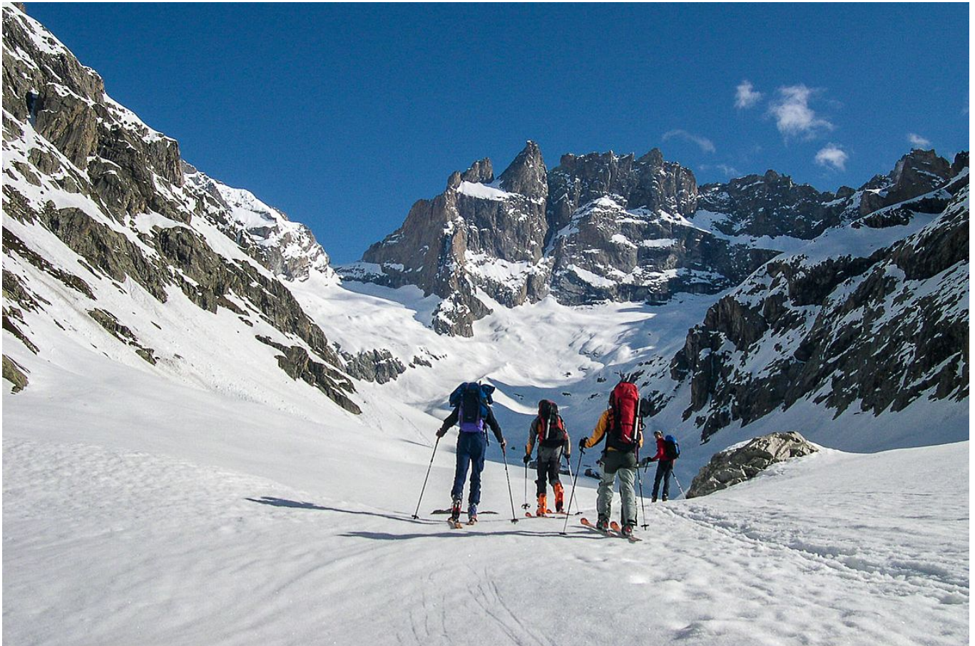
Blick zur Meije im Aufstieg zum Refuge Promontoire Gemütlicher sechster Tag unserer Skidurchquerung der Dauphiné

An diesem Tag steht "nur" ein Hüttenaufstieg auf dem Programm - ohne technische Schwierigkeiten und mit nur 1300 Höhenmeter. Nach der vergleichsweise noblen Unterkunft in La Bérarde wäre es der "Ruhetag" dieser Woche gewesen. Allerdings wollte unser Jungspund Tobi im 800-Meter-Schlusshang unbedingt ein Wettrennen anzetteln, worauf ich nicht verzichten konnte. Also doch kein Ruhetag. Der Hüttenanstieg durch die Mittagssonne in dem großen Südkar entpuppt sich dadurch dann doch recht schweisstreibend. Dafür können wir anschliessend auf der supergemütlichen Sonnenterrasse wieder richtig relaxen.